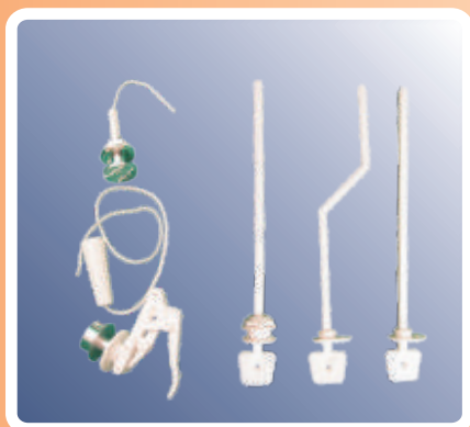
WC tartályharang emelő kar WC tartály lehúzó és nyomógomb